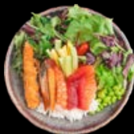
S10. SUSHI DON 3, 5, 17 14,90 Lachs, Thunfisch, Unagi, Surimi, Ebi Tempura, Ebi, Salatmix, Avocado, Mangostreifen, Edamame, Seetang, Sushi Reis Salmon, tuna, eel, surimi, Ebi tempura, Ebi, salad mix, avocado, mangostrips, edamame, seaweed, sushi rice