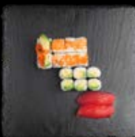
S5. SUSHI 5 5, 17 13,90 6 Stk Avocado Maki 8 Stk Sake Avocado I.O 2 Stk Tuna Nigiri