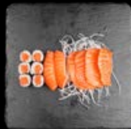
S7. SUSHI 7 5, 17 15,90 4 Stk. Sake Sashimi 2 Stk. Sake Nigiri 6 Stk. Sake Maki