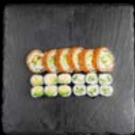
S4. SUSHI 4 5, 17, 1 12,90 6 Stk. Avocado Maki 6 Stk. Kappa Maki 6 Stk. Veggie Crunch