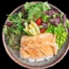
S8. VEGGIE BOWL 3, 5, 17 10,90 Bio Tofu, Salatmix, Avocado Mangostreifen, Edamame, Seetang, Sushi Reis Organic tofu, salad mix, avocado, mangostrips, edamame, seaweed, sushi rice