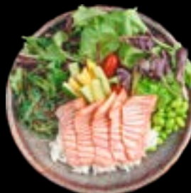
S9. SAKE FIRE BOWL 3, 5, 17 13,90 Flambierter Lachs, Salatmix, Avocado, Mangostreifen, Edamame, Seetang, Sushi Reis Flambéed salmon, salad mix, avocado, mangostrips, edamame, seaweed, sushi rice