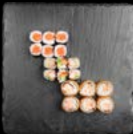
S2. SUSHI 2 5, 17, 1 12,90 6 Stk. California Maki 6 Stk. Sake Maki 6 Stk. Tempura Sake Mini Roll