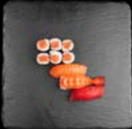
S1. SUSHI 1 5, 17 9,90 6 Stk. Sake Maki 3 Stk. Nigiri (Sake, Maguro, Ebi)

Jedes Mittags-Lunch enthält eine Miso-Tofu Suppe (optional 3 vegetarische Mini Frühlingsrollen)