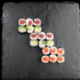
S3. SUSHI 3 5, 17 12,90 6 Stk. Sake Maki 6 Stk. Avocado Maki 6 Stk. Tekka Maki