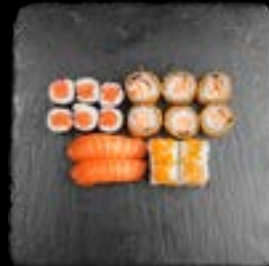
S6. SUSHI 6 5, 17, 1 14,90 6 Stk. Sake Maki 4 Stk. California I.O 2 Stk. Sake Nigiri 6 Stk. Tempura Sake Mini Roll